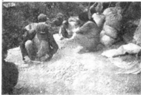
ခဲကို ထုလို့ ကျောက်ကိုရ၊ ခဲစာထုနေကြတာပါ။

မြေတွင်းဖက်စပ်မြောင်းမြီးတွေမှာ ခန္ဓဆေးသူတွေကျတော့ ကျောက် အသေးအညှာပဲ ရနိုင်တယ်။ ဘာလို့လဲဆိုတော့ ဖက်စပ်တွေက မြီးဆေးရင် ကျောက်တွေ ရေအားနဲ့ ပါမသွားအောင် ဆန်ခါကို သေသေချာချာ ကာထား တယ်။ ကြီးတဲ့ကျောက်တွေဟာ သံဆန်ခါကို ကျော်ပြီး ဘယ်လိုမှ ပါမသွား နိုင်ပါဘူး။ သံဆန်ခါအပေါက်ထက်သေးတဲ့ ကျောက်လောက်ပဲ အပြင် ရောက်တော့ ခန္ဓဆေးသူတွေဟာ ထမင်းစားကျောက်လောက်ပဲရနိုင်တယ်။ ခဲစာကျတော့ ခဲတွင်းကွက်ရပ်တစ်ခုနဲ့တစ်ခု စွန့်ပစ်တာမတူဘူး။ ကျောက် ကျပြီး ကျောက်ကြီးပဲထွက်တဲ့ခဲကြောမျိုးကျတော့ စွန့်ပစ်တဲ့ခဲစာက ကြီး တယ်။ ကျောက်အရည်လှပြီး ကျောက်အညှာစိတ်တဲ့ ခဲကြောကျတော့ စွန့်ပစ်တဲ့ခဲစာက သေးတယ်။ ဥပမာပြောရရင် ကိုးလံဘက်က တွင်းတွေဟာ ကျောက်ဖောက်တယ်။ ကျောက်ကြီးထွက်တာ များတယ်။ ကျောက်အမျိုး ကတော့ ကောင်းတဲ့အကြောက ကောင်း၊ ညံ့တဲ့အကြောကညံ့ပေါ့။ သည်