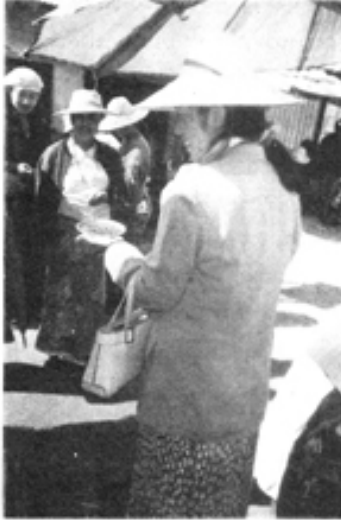
ပိတ်စွယ်ပန်းခြံ အပြင်ထာပွဲမှာ “ထာ” လို့ တွင်တဲ့ ကြေးလင်ဗန်းနဲ့ အရောင်းအဝယ်လုပ်နေတဲ့ မိုးကုတ်သူတစ်ဦး

“သည်ကျောက်ထုပ်တွေထဲမှာ အတုတွေရော မပါနိုင်ဘူးလား” “ပါတာပေါ့ စာရေးဆရာရယ်၊ ဒါပေမယ့် အသေးအညှာ ကျောက် အရိုင်းအစပ်သမားတွေဟာ သည်လိုပဲအပေါ်ယံကြည့်ပြီး ဝယ်ရတာ။ သိပ် မသင်္ကာစရာကောင်းတဲ့ကျောက်တစ်ပွင့် နှစ်ပွင့်လောက်ကိုပဲ သေသေချာချာ ကြည့်နိုင်ပြီး ကျန်ကျောက်တွေကို ဒုံး(အထုပ်လိုက်)ဆစ်ရတာဆိုတော့ ကျောက်အတုတွေ အနည်းနဲ့အများတော့ ပါတာပဲ။ နောက်ပိုင်းတော့ အသေး၊ အညှာအစပ်ကျောက်ထုပ်သမားတွေဟာ လူကြည့်ပြီးတော့ ဝယ်ရ တာပါပဲ။ မိုးကုတ် ကျောက်လောကမှာ နာမည်ပျက် မရှိဖို့သာ အဓိကမို့