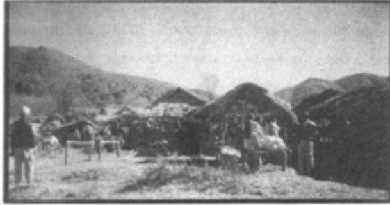
ဘားနတ်ဈေးထာပွဲ

*စာရေးဆရာ၊ သည်မြင်ကွင်းၤမျိုးက တွေ့ရခဲတယ်။ ဓာတ်ပုံရိုက်ချင် ရိုက်ထားနော်*