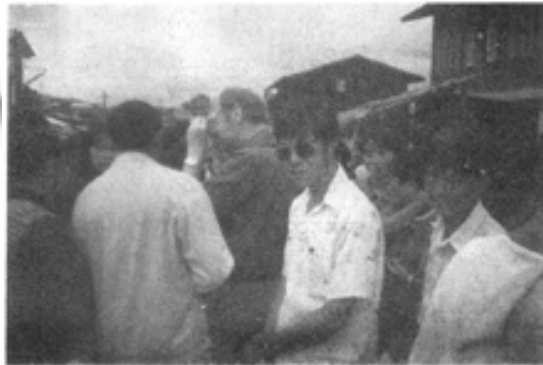
လယ်ဦးထာပူရောက် နိုင်ငံခြားသားတစ်ယောက်

လက်ဖက်ရည်ဆိုင်၊ ခေါက်ဆွဲဆိုင်တို့တွင် တွင်းသမားများ၊ ကျောက်ကုန် သည်များ ပြည့်နေပြီဖြစ်သည်။ မိုးကုတ်မြို့တွင် အရှေ့ပိုင်းနှင့်အနောက်ပိုင်း ဆိုပြီး နှစ်ခြမ်းရှိသည့်အနက် မိုးကုတ်မြို့အရှေ့ပိုင်းတွင်သာ နံနက်စောစော ထာပူရှိသည်။ အနောက်ပိုင်းတွင်မူ နံနက်အစောကြီးဖြစ်သော ထာပူမရှိပေ။ အကြောင်းမှာ အနောက်ပိုင်းသည် အရှေ့ပိုင်းထက်စာလျှင် တွင်းလုပ်ငန်း များစွာရှိရာ နံနက်စောစောတွင် ထာပူဟူ၍ သီးခြားစုမနေတော့ဘဲ ကျောက် ပြဿဒ်၊ ဆင်ရွာ၊ ဘောလုံးကြီး၊ ဘောလုံးလေး၊ ဘော်မားစသော နီးစပ်ရာ ရွာများသို့သွား၍ ကျောက်ဝယ်ကြသည်။ ထိုသို့ ရွာပိုင်းတစ်လျှောက် အစောကြီး ကျောက်လိုက်ဝယ်ပြီးမှ ထာပူသို့ဝင်ကြရာ အနောက်ပိုင်းထာပူ သည် အစောဆုံး ၁၀နာရီလောက်မှ စစည်ခြင်းဖြစ်သည်။ မိုးကုတ်အရှေ့ပိုင်း မှာမူ တွင်းလုပ်ငန်းများလုပ်ကိုင်ရာ ရွာများနှင့်ပေးပါသည်။ ထို့ကြောင့်လည်း တွင်းသမားအများစု သွားလာရာ လမ်းခုလတ်ဖြစ်သော လယ်ဦးရွာလမ်းမ ကြီးတွင် ကျောက်စောင့်ဝယ်ကြရာမှနေ၍ နံနက်စောစော ထာပူတစ်ခု ဖြစ်လာပါသည်။