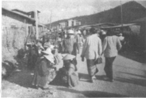
ရွက်ချထားပွဲထဲမှာ ရောင်းဝယ် ဖွေရှာ၊ လူးလာ စုန်ဆန်