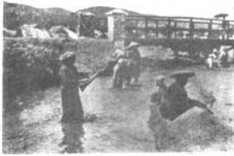
ကိုလိုနီခေတ်က ခန္ဓဆေးနေကြတဲ့ ဒေသခံအမျိုးသမီးတွေ

သမားများအား အိတ်ပါသောအဝတ်အစားများ မဝတ်ဆင်ခိုင်းသလို ကျောက်များကိုလည်း မျိုမချနိုင်အောင်ဆိုပြီး ကျောက်ရွေးသည့် အလုပ် သမားတိုင်းကို လည်ပင်းထိရောက်သည့် သော့ခတ်ထားသော ခေါင်းဆောင်းများကို စွပ်ထားပေးပါသည်။ ထိုသို့ အဆင့်ဆင့် ရွေးပြီး၍ စွန့်ပစ်လိုက်သော ကျောက်ဖြုန်းများ(သဲပတ်များ)ကိုမှ တစ်လ ၂၀၀/-နှုန်း ကောက်ခံ၍ ဒေသခံအမျိုးသမီးများအား ရွေးစေခြင်းဖြစ်သည်။