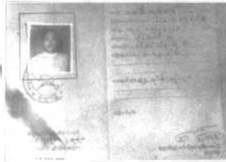
၁၉၆၅ ကျောက်တွင်းလုပ်ပိုင်ခွင့် မှတ်ပုံတင်လက်မှတ် အတွင်းမျက်နှာ။