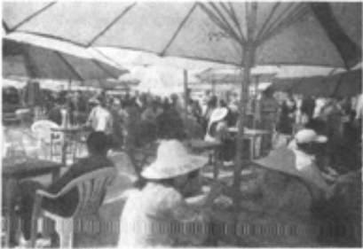
ပိတ်စွယ်ပန်းခြံ ထာပွဲအတွင်းမှာ သည်လိုရောင်းဝယ်နေကြတယ်။

မိုးကုတ်မြို့တွင် ထာပွဲဖြစ်ရာနေရာ များစွာရှိသော်လည်း သီးခြားဝင်းနှင့် ကိုယ်ပိုင်ခုံနှင့် အလုပ်လုပ်နိုင်သည်မှာ ပိတ်စွယ်ပန်းခြံထာပွဲတစ်ခုသာ ရှိပါသည်။ ဝင်းအတွင်းတွင်လည်း ကား၊ ဆိုင်ကယ်များ အပ်ရန် သီးခြားနေရာရှိပါသည်။ ထာပွဲဝင်ကြေးမှာ လူတစ်ဦးလျှင် ငါးကျပ်နှုန်း၊ ဆိုင်ကယ်တစ်စီး အပ်ခနှုန်း နှစ်ဆယ်ကျပ်၊ ကားတစ်စီး အပ်ခနှုန်း နှစ်ဆယ့်ငါးကျပ်ဖြစ်သည်။ အတွင်းတွင် ကိုယ်ပိုင်ခုံ ထားနိုင်သူများအဖို့ စားပွဲဝိုင်းနှင့် ထိုင်ခုံနှင့် စတိုင်ကျကျထိုင်ပြီး အရောင်းအဝယ် လုပ်နိုင်ပါသည်။ ရာသီဥတု ဒဏ်ခံနိုင်ရန်အတွက် မိုးကာဖြင့်ပြုလုပ်ထားသော ထီးကြီးများ မိုးထားပါသည်။ ခုံများ၊ ထီးများကိုမူ ကိုယ်တိုင်ဝယ်ရပြီး ထိန်းသိမ်းစောင့်ရှောက်ခအဖြစ် ထာပွဲလေလံရသောအဖွဲ့သို့ တစ်လလျှင် ၇၀၀၀နှုန်း ပေးရသည်။ ယခုနှစ်အတွက် ထာပွဲလေလံရထားသည့် အဖွဲ့အစည်းမှာ မိုးကုတ်မြို့နယ် စစ်မှုထမ်းဟောင်းအဖွဲ့မှ ဖြစ်သည်။