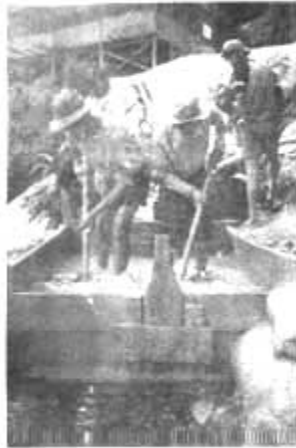
လေးထောင့် သစ်သားကန်ထဲမှာ မြန်းဆေးနေကြတဲ့သူတွေ

လေးပင်တွင်းတူးနည်းစနစ်မှာ မိုးကုတ်ကျောက်တွင်းနယ်မြေတွင် အများစုလုပ်ကိုင်သော နည်းစနစ်ဖြစ်ပြီး တွင်းတစ်တွင်းလျှင် ပုံမှန် လူငါးယောက်ခန့်လိုပါသည်။ ရေထွက်များသော တွင်းများ၊ အဆက်နက်သော