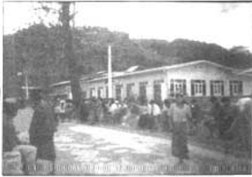
မင်းတံတားထာပွဲ ရှုခင်း

*စာရေးဆရာ၊ ကျွန်တော်တို့ ဘယ်လမ်းကပြန်မလဲ။ မင်းတံတားထာပွဲ