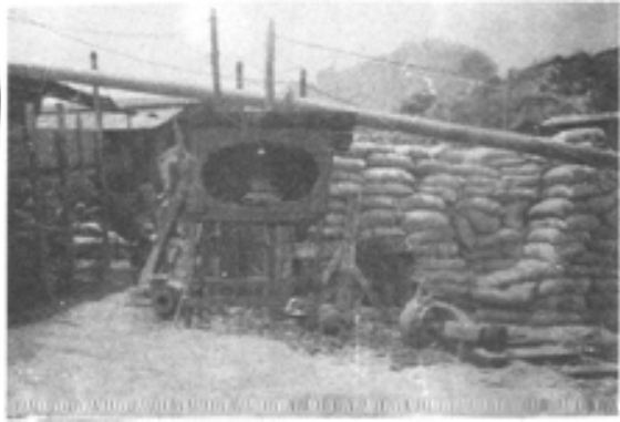
ကျောက်တွင်းတစ်တွင်းမှာ မြင်ရမြဲ ရိုးရာနတ်စင်