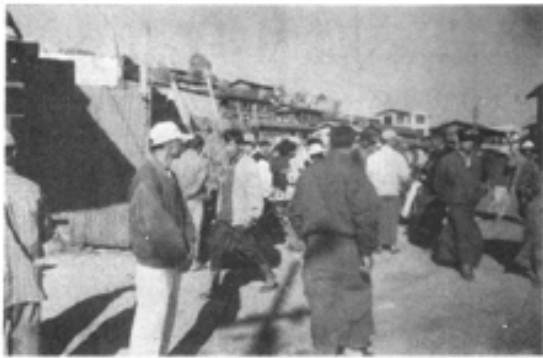
ဗဟိုရုပ်ရှင်ရုံရှေ့ လမ်းမကြီးပေါ်က ထာပွဲ

လယ်ဦးထာပွဲမှ ကျောက်ကုန်သည်များကိုလည်း လျှော့တွက်၍ မရပါ။ ကျောက်ကို ဈေးကုန်ရအောင်ရောင်းသည့်နေရာတွင် စံတင်လောက်ပါသည်။ နိုင်ငံခြားသားစဉ်သည်များ၊ ပြည်တွင်းမှ ကျောက်မျက်ပညာရှင်များ၊ သင်တန်းသူသင်တန်းသားများ မိုးကုတ်မြို့သို့ရောက်တိုင်း သဘာဝ ကျောက် အဆန်းများ၊ ခရစ္စတယ်ကျောက်များ စုံလင်စွာ တွေ့ရသည့် လယ်ဦးထာပွဲသို့ အရောက်လာကြပါသည်။ ရောက်လာတိုင်းလည်း အနည်းနှင့်အများဆိုသလို