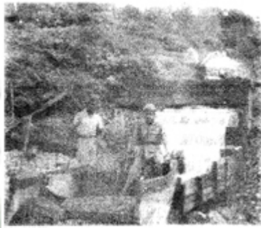
လိုင်စင်ခေတ်က ကျောက်တွင်းတူးလုပ်ငန်းမှာ လုပ်ကိုင်နေကြပုံ