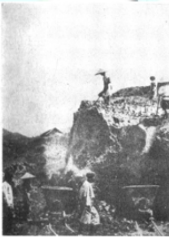
ကိုလိုနီခေတ်က ကျောက်တွင်းလုပ်ငန်း လုပ်ကိုင်နေကြပုံ

အင်္ဂလိပ်ခေတ်(ဘားမားရှာဘီမိုင်း ကုမ္ပဏီလီမိတက်)၏ ကျောက်တွင်း တူးလုပ်ငန်း လုပ်ကိုင်ပုံအဆင့်ဆင့်ကို ဗဟုသုတအဖြစ် ဖော်ပြလိုပါသည်။ ကုမ္ပဏီသည် အင်းမြစ်ခေါ် စက်တွင်းများကို ဦးစားပေးလုပ်ကိုင်ခဲ့ပြီး