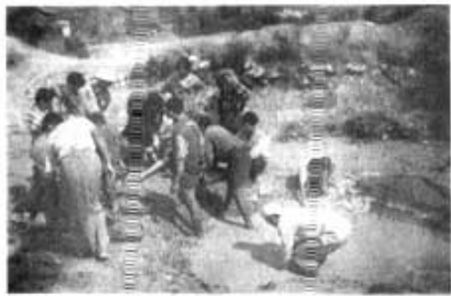
မြူးဆေးပြီးသား သဲပတ်(သဲဖတ်)ထဲမှာ ကျောက်ရလေနိုး မျှော်ကိုးသူများ

သည်။ ခဲတွင်းများအလုပ်ဖြစ်ချိန်ဆိုလျှင် ခဲစာထုသူ လူဦးရေသည် ခန္တေဆေး သူ လူဦးရေထက် ပိုများပါသည်။ ခန္တေဆေးသူ၊ ခဲစာထုသူများ၏ ဝင်ငွေကို မှီ၍ စားသောက်သူမိသားစုများလည်း နောက်ကွယ်တွင် ရှိပါသေးသည်။ ထို့ကြောင့် မိုးကုတ်ကျောက်တွင်းနယ်မြေတွင် ဖက်စပ်ကျောက်တွင်းများ၏ စွန့်ပစ်လုပ်ငန်းများ၊ တစ်နည်းအားဖြင့် ခန္တေဆေးလုပ်ငန်းနှင့် ခဲစာထုလုပ်ငန်း များကို မှီ၍ လုပ်ကိုင်စားသောက်သူ လူဦးရေမှာ သောင်းဂဏန်းထိရှိနိုင် ကြောင်း အကြမ်းဖျဉ်း ကောက်ချက်ချနိုင်ပါသည်။