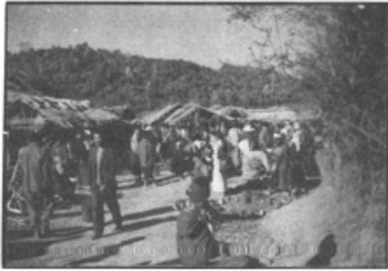
စည်စည်ကားကား၊ ဘားနတ်ဈေးထာပွဲ လာသူများ

ပြောင်ခေါင်းစိမ်းကျောက်များမှာ ယခုနှစ်ထဲတွင် အလွန်ပင် အဝယ် လိုက်နေပါသည်။ ဝယ်ရပြီးလျှင် လက်ထဲကြာကြာ အောင်းမနေပါ။ အစိမ်း ရင့်လျှင်လည်း ရင့်သည့်ဈေး၊ ဖျော့လျှင်လည်း ဖျော့သည့်ဈေးနှင့် ချက်ချင်း ပြန်ရောင်း၍ရပါသည်။ ပြီးခဲ့သည့် နှစ်နှစ်ကျော်၊ သုံးနှစ်လောက်ကမူ မိုးကုတ် ပြောင်ခေါင်းစိမ်းကျောက်များ ဈေးကွက်ပျက်ပြီး ဈေးထိုးကျသွား ဖူးပါသည်။ ထိုစဉ်က တရုတ်ပြည်က ထွက်သည်ဆိုသော ပြောင်ခေါင်းစိမ်း ကျောက်များ(ကျောက်ကုန်သည်လောကအခေါ် တရုတ်စိမ်းများ)မိုးကုတ်