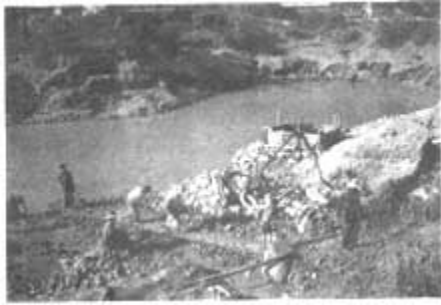
အင်းမြဲ (အင်းပြဲ)

လက်နဲ့လုပ်တဲ့နေရာမှာ စက်ကို အစားထိုးပြီး လုပ်ကိုင်တာပဲကွာတယ်။ နည်းစနစ်ကတော့ လုံးဝ မပြောင်းသွားဘူး။ ရှေးက လုပ်ခဲ့တဲ့ နည်းစနစ်တွေပဲ။ လူအားနေရာမှာ စက်အားကို အသုံးပြုလာတာမို့ လုပ်ငန်းတွင်ကျယ်မှုကတော့ တအားကွာတယ်။ အရင်က နှစ်ချီလုပ်ရမယ့် အလုပ်တွေဟာ လပိုင်းအတွင်းမှာပဲ ပြီးသွားတယ်။