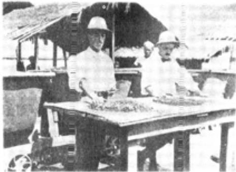
ကိုလိုနီခေတ်က ကိုယ်တိုင်ကျောက်ရွေးနေကြတဲ့ မျက်နှာဖြူဝန်ထမ်းတွေ

ရှေးဦးစွာ အပေါ်ယံမြေသားများအား ရှင်းပစ်သည့် ခေါင်းမိုးကျင်း လုပ်ငန်းနှင့် အောက်ခြေမြှေးတူးသည့်လုပ်ငန်း ရောက်သည်ထိ အလုပ်သမား လူအင်အားဖြင့် လုပ်ကိုင်လိုက်သည်။ မြှေးကြောရောက်ပြီဆိုလျှင် တွင်း၏ အောက်ခြေမှနေ၍ အပေါ်ရှိ မြှေးဆေးစက်သို့ ရောက်သည်ထိ သံလမ်းများ ခင်း၍ ဆက်သွယ်လိုက်ပါသည်။ ထို့နောက် သံလမ်းအတိုင်း သော့ခတ်ထားသော မြှေးလှည်းများကို စက်သီးများ၊ သံမဏိကြိုးများ အကူအညီဖြင့် အတင်အချ ပြုလုပ်ပါသည်။ မြှေးဆေးစက်ရှိရာသို့ ရောက်လာသော မြှေးများကို ရေပုံခေါ် အချင်း ၁၄ပေခန့်ရှိ ပက်လက်အိုးကြီးထဲသို့ သွန်ထည့်ကာ ရေအားဖြင့် သဲများ၊ ရွံ့များ၊ ခဲလုံးများ စင်သွားအောင် ဆေးလိုက်ပါသည်။ ထိုသို့ ပြုလုပ်ခြင်းကို ရေပန်းရိုက်သည်ဟုလည်း ခေါ်ပါသည်။ ရေဆေးပြီးသော မြှေးများကို အမြဲတမ်းလှုပ်ခါနေသည့် အိုးထဲတွင်ထည့်ကာ ရေမပြတ်တမ်း လောင်းပေးပါသည်။ ထိုအခါ သိပ်သည်းဆများသော ကျောက်စရစ်ခဲများနှင့် ကျောက်များသည် အိုး၏ အလယ်ပိုင်းတွင် စုပြီး တဖြည်းဖြည်း