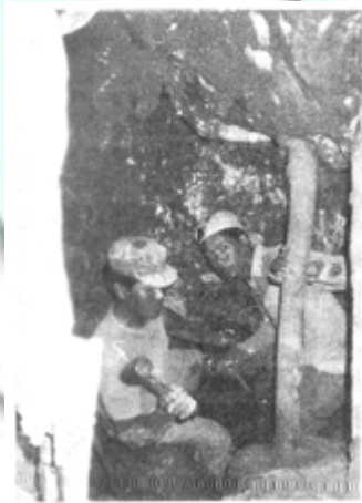
ခဲတွင်းတစ်တွင်းရဲ့ အထဲမှာ အလုပ်လုပ်လို့နေကြတာ . . .

*ခဲတွင်းတွေထဲမှာတော့ ကျွန်တော်တို့ ကတုတ်တပ် ကွက်ရပ်က ရေထွက်အများဆုံးနဲ့ ကုန်ကျစရိတ်အများဆုံးဖြစ်မယ်ထင်တယ်။ တွင်း လုပ်ငန်း မစခင် အောင်းရေတွေကုန်အောင် စုပ်ထုတ်ရတာကို တစ်လနီးနီး ကြာတယ်။ ဒါတောင် ကွက်ရပ်တစ်ခုလုံးမှာရှိတဲ့ တွင်းတွေအားလုံးစုပြီး နေ့ည မနားဘဲ စက်ကြီးတွေနဲ့ ဆက်တိုက်စုပ်ထုတ်ရတာ။ ကိုယ့်တစ်တွင်း တည်းဆိုရင် ရေကုန်အောင်စုပ်ထုတ်ဖို့မလွယ်ဘူး။ သည်တော့ တွက်ကြည့်