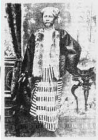
“ပတ္တမြားဘုရင်” ဘွဲ့ခံ ဘုရားတကာကြီး ဦးမှတ်

ဒေါ်ဖုံခေတ်က တွင်းသမားလုပ်ခဲ့သူ ယခုလည်း လောသတောင်နီလာ