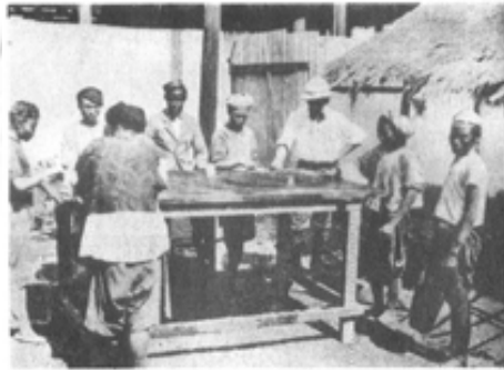
မျက်နှာဖြူရဲ့ အနီးကပ်စောင့်ကြပ်မှုနဲ့ ကျောက်ရွေးနေကြတဲ့ ဒေသခံတွေ

အောက်သို့ ကျသွားပါသည်။ အိုး၏ အလယ်တည့်တည့်တွင် အပေါက် ဖာစ်ရရှိပြီး ထိုအပေါက်ထဲတွင် ခွေးသွားစိတ်များပါသော တိုင်တစ်တိုင် သည် ထွက်ချည်ဝင်ချည်ဖြင့် အထက်အောက်လှုပ်ရှား လည်ပတ်လျက်ရှိ သည်။ ထိုအခါ ဖွင့်လိုက်ပိတ်လိုက် ဖြစ်နေသော အိုး၏ အပေါက်ထဲသို့ ကျောက်စရစ်ခဲများ၊ ကျောက်များမှာ ရေ၏ စုပ်အားဖြင့် ကျလာခြင်းဖြစ် သည်။