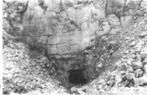
ခဲတွင်းတစ်တွင်းရဲ့ အဝင်ဝကို အပြင်က မြင်ရတဲ့ပုံ

ထိန်းသိမ်းရသည့် အဆင့်ထိပင် ရောက်ခဲ့ပါသည်။