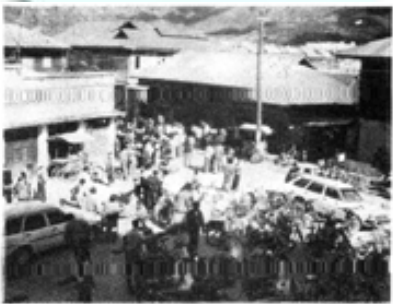
မိုးကုတ်ရုပ်ရှင်ရုံထာပွဲရှုခင်း

‘သည်အရိုင်းပုံတွေ ကြားကနေပြီး ခရစ္စတယ် ကျောက်ကောင်းတွေ၊ ကျောက်အဆန်းတွေကို တစ်ခါတစ်ခါ ဈေးပေါပေါနဲ့ ဝယ်ရတတ်တယ်’