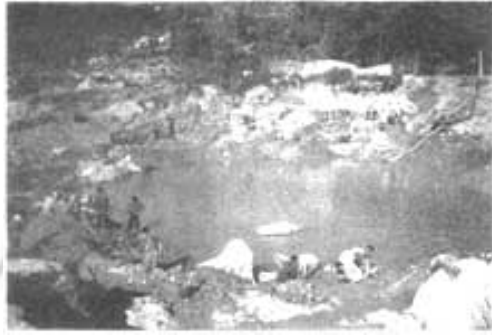
ကျောက်ထွင်းတူးတဲ့အခါ စိမ့်ထွက်လာတဲ့ ရေတွေ၊ ရေတွေ...

ထွင်းတူးရင်း မြီးကြောတွေပြီဆိုရင် မြီးအတိမ်အနက်(အထူအပါး)နှင့် မြီးကြောသွားရာ လမ်းအနေအထားကို ကြည့်ပြီး အောက်သို့ဆက်တူးရ သည်လည်းရှိသည်။ ဘေးဘက်သို့ ဆက်တူးပြီး ဝင်သွားရသည်လည်း ရှိသည်။ ဘေးဘက်သို့ ဆက်တူးပြီး ဝင်သွားရခြင်းကို မိုးကုတ်ဒေသခံများ က ခေါင်းသားထိုးသည်ဟု ခေါ်သည်။