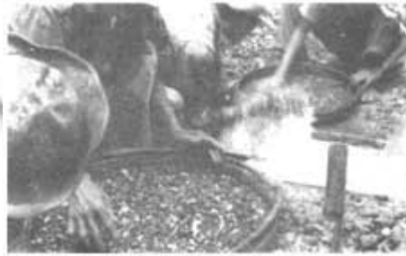
လိုင်စင်ခေတ်က ဆန်ကာတိုက်ပြီး ကျောက်ပြန်ရှာနေကြပုံ ယာအောက်ခြေမှာထောင်ထားတဲ့ ကျည်တောက်ထဲ ကျောက်တွေထည့်တာ။